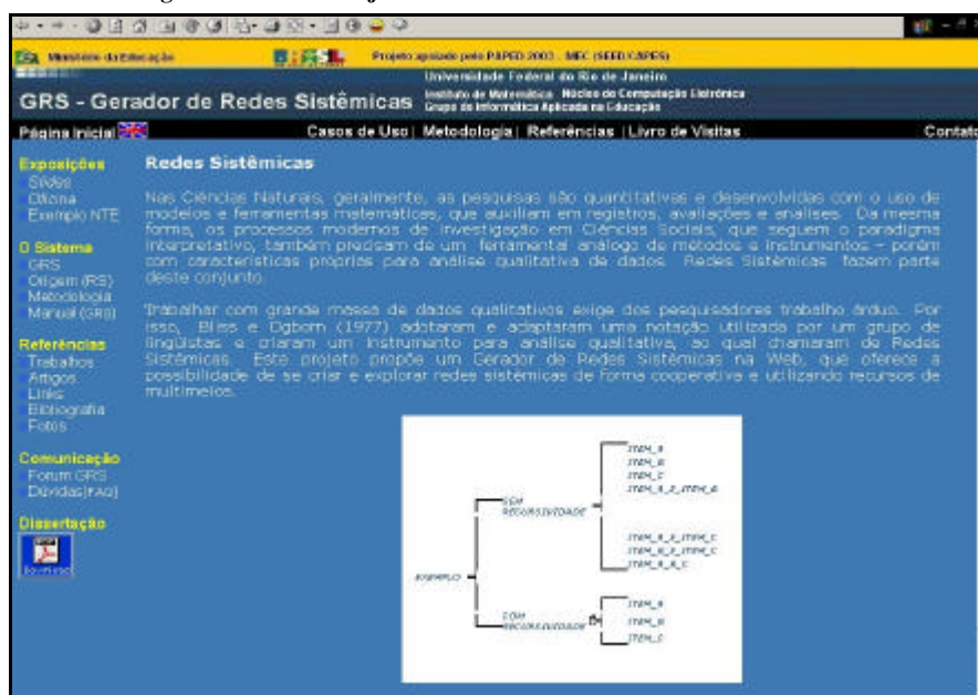
Figura 3 – Tela do Projeto GRS – Gerador de Redes Sistemáticas na Web